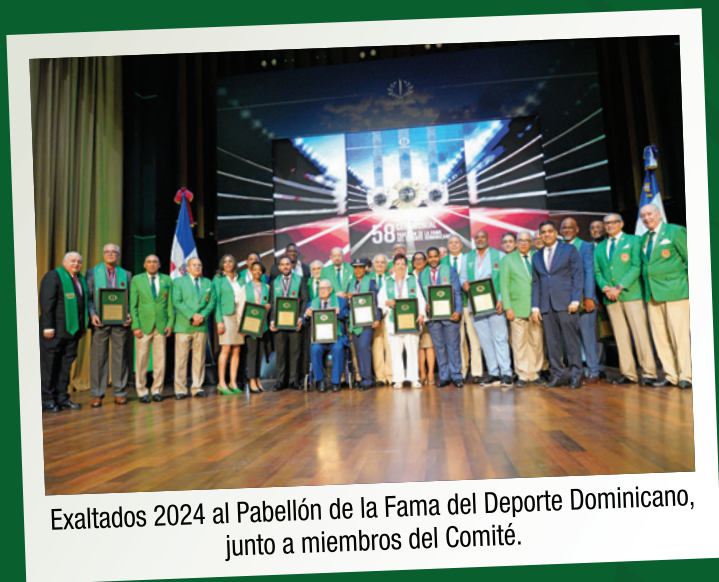
Exaltados 2024 al Pabellón de la Fama del Deporte Dominicano, junto a miembros del Comité.