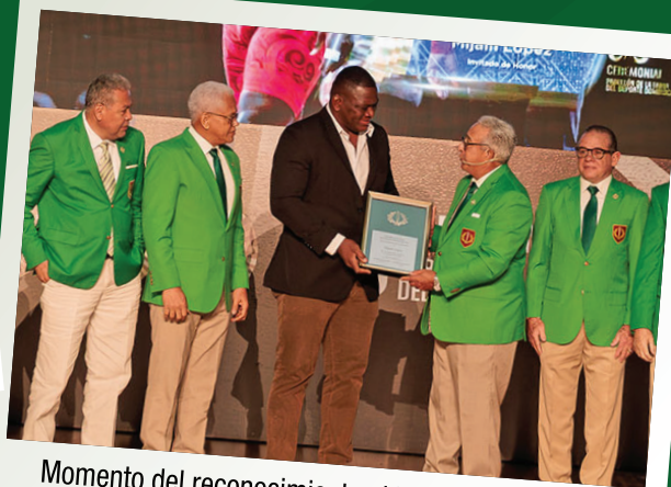
Momento del reconocimiento al luchador olímpico Mijain López, invitado especial al Ceremonial 58.