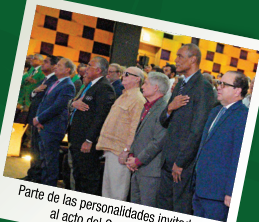
Parte de las personalidades invitadas al acto del Ceremonial.