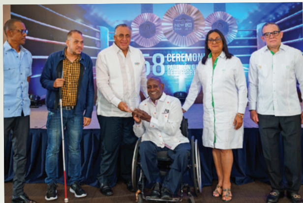
Reconocimiento al Comité Paralímpico Dominicano.