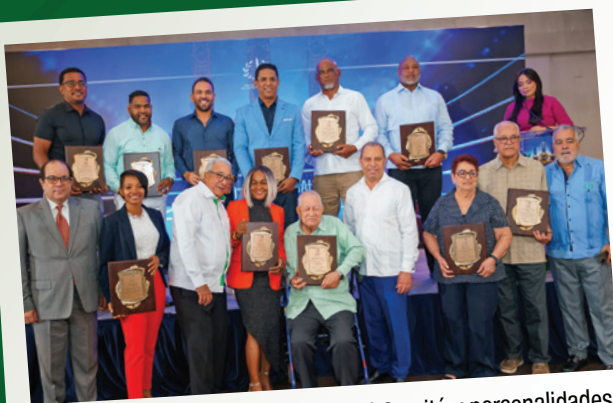
Los exaltados junto al Presidente del Comité y personalidades.