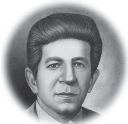
Emil Kasse Acta